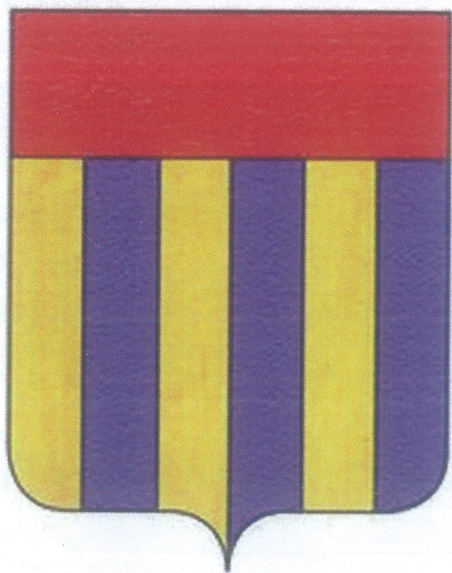
Stemma della casata dei Priuli.

asciutta. Quattro anni dopo, nel 1559, Girolamo Priuli divenne Doge, e fu un Doge molto importante per la Repubblica Veneta. Fu proprio lui a sancire il riconoscimento legale della Fiera del Zocco, regolata con apposite disposizioni.