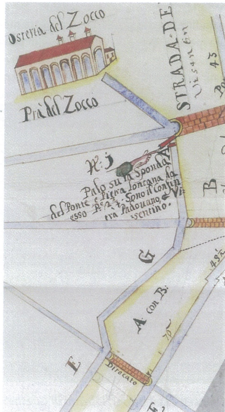
L'Osteria del Zocco in una carta del Settecento