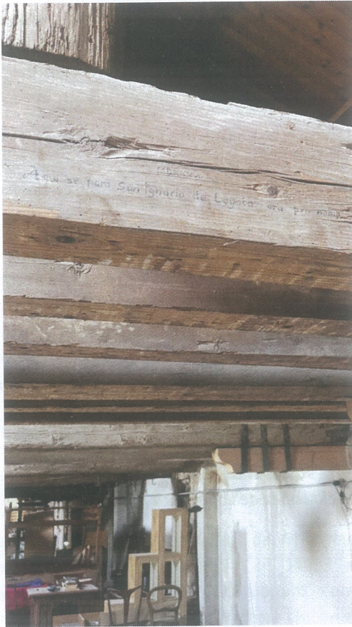
La scritta sulla trave.

All'alba del miracolo economico la Fiera del Zocco era ancora fortemente legata al mondo agricolo e alla compravendita del bestiame, soprattutto dei cavalli. Con il progressivo mutamento, a partire dagli anni Sessanta e Settanta questa funzione centrale ha