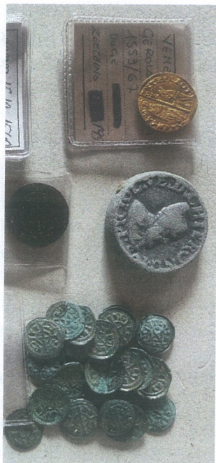
Zecchino d'oro del Doge Girolamo Priuli

Il 26 settembre 1786, dopo la visita fatta a Vicenza, Johann Wolfgang Goethe (1749-1832) sostò al Zocco a causa di una ruota della carrozza («un legnetto ad un posto solo, a cui danno nome di sediolò») andata in pezzi proprio davanti alla locanda. All'interno del Ristorante Al Zocco è conservata una targa in pietra in ricordo della sua sosta durante il famoso "viaggio in Italia". A quel tempo, da Vicenza si poteva raggiungere «Padova in tre ore e mezza», ma Goethe preferì godersi il paesaggio e non mettere fretta al vetturino. La sera di quel giorno, lo scrittore tedesco descrisse le nostre campagne annotando: «Si cammina in una pianura fertilissima,