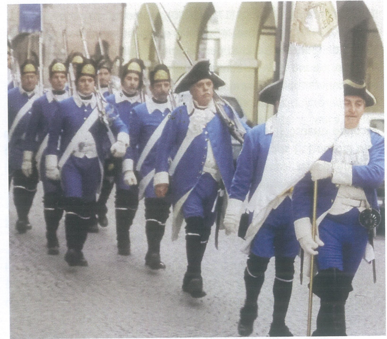
Divise veneziane del Settecento in una rievocazione storica

Nel 1797 Napoleone, dopo aver fatto cadere la Repubblica di Venezia (12 maggio 1797) e dopo aver anche saccheggiato Padova, fece tappa di ritorno a Grisignano. Le truppe francesi passarono più volte avanti e indietro per Grisignano e si accamparono nella barchessa del Zocco. A Padova i militari francesi avevano derubato anche la basilica di Sant'Antonio di preziose opere e oggetti di valore, ma più di tutto minacciarono di rapire le reliquie del Santo.