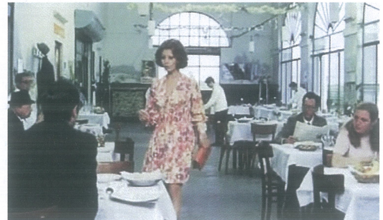
Sofia Loren al Zocco.

Dal 1968 al 1990, nella sala del ristorante detta di Montecitorio vennero decisi alcuni tra i più grandi scioperi nazionali e regionali d'Italia. Il ristorante al Zocco era punto d'incontro dei vari sindacati CGIL CISL UIL. Tra i protagonisti di quel periodo si ricordano Pierre Carniti (1936-2018), Giorgio Lama (1921-1996), Bruno Oboe (1940-1917) e Luciano Violante.