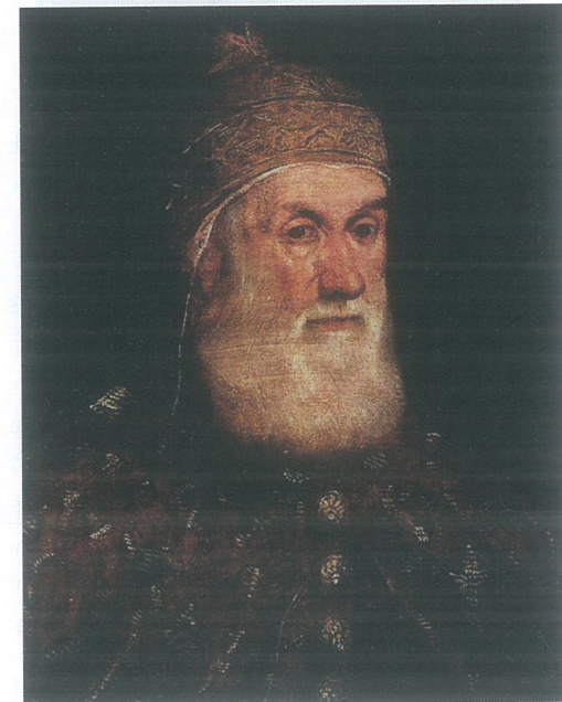
Jacopo Tintoretto, Ritratto del Doge Girolamo Priuli .